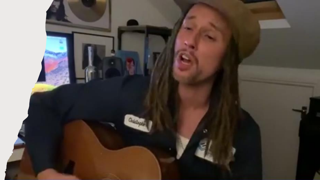
Hier singt JP COOPER - Und HIER spielt die Musik, wenn du SPENDEN möchtest caritas-international.de/livekonzert